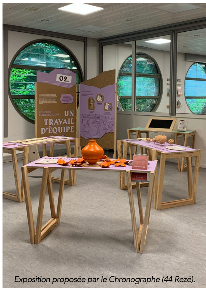
Exposition proposée par le Chronographe (44 Rezé).

Du 4 avril au 31 mai, Terre d'Estuaire vous propulse des siècles en arrière ! Venez découvrir l' Exposition "Chronomobile - Laboratoire de l'archéologie" .