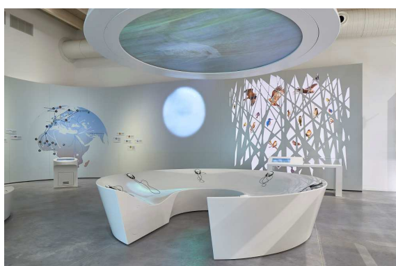
Manipuler - Les migrations