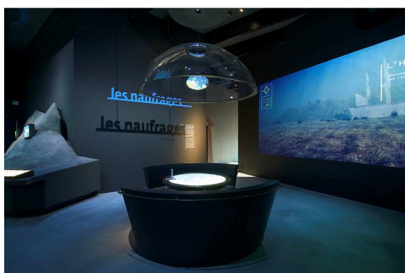
Sous l'eau - Les naufrages