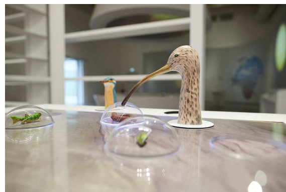
Manipuler - Expérience scientifique